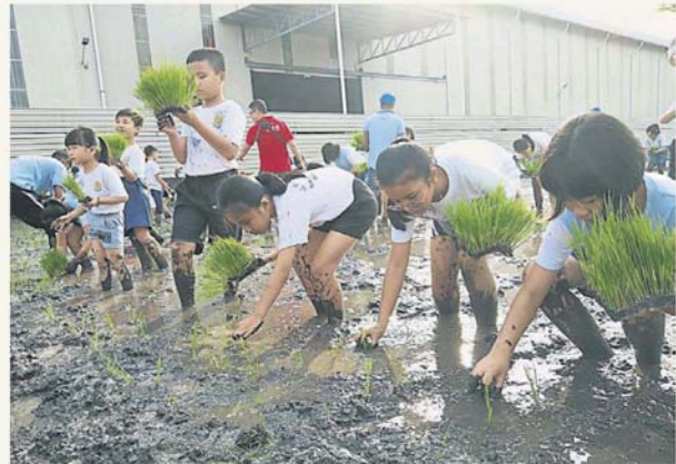
尽管稻田内的泥浆又黑又黏，但学生并不觉得害怕或恶心，认真把稻苗插在正确的位置。

他说，随着适耕庄州议员黄瑞林成功为主要道路设街灯，夜晚的稻田也非常安全，未来考虑设立晚间导览行程，例如在辽阔的稻田观星，与观察稻田的夜行动物