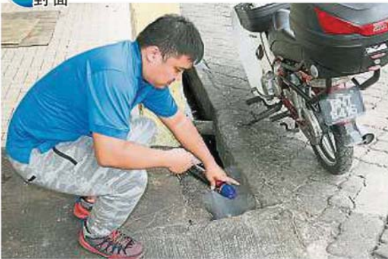
店員無奈每日需噴射好幾次的蚊油滅蚊。