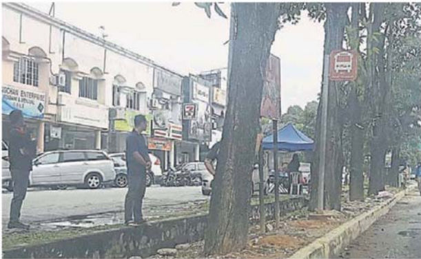
锡米山美华园店屋前，搭客站在树下等巴士。