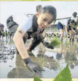
■长时间的徒手插秧考验耐力，对学生