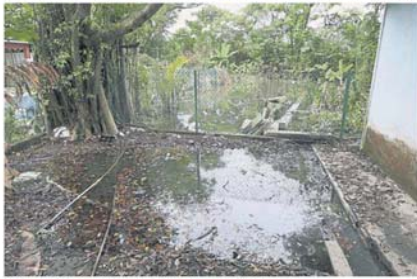
幼稚园四周仍可见到积水及枯叶，引发卫生问题。

每次水灾时，环保站的厕所水就会上升，甚至发出阵阵的臭味，难以忍受。我们在处理资源时，也面对不便，鞋子常被水弄湿。