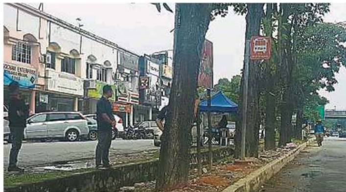
錫米山3个巴士站牌的“候车站”设备简陋，将进行提升为候车亭。