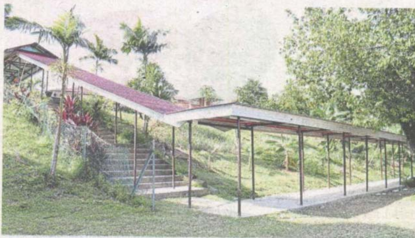
SMK Subang Jaya's covered walkway has been repaired.

SMK Subang Jaya students are now protected from the sun and rain after the completion of repairs to its covered walkway.