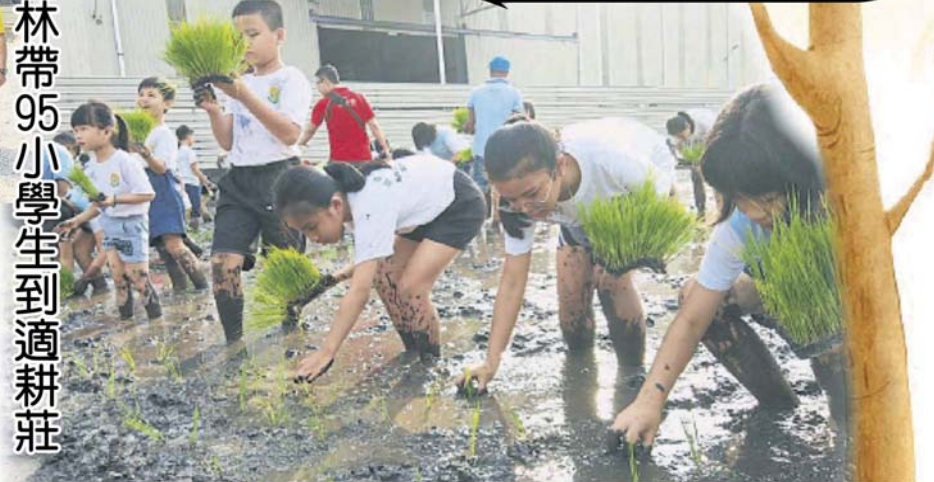
■尽管稻田内的泥浆又黑又黏，但学生并不觉得害怕或恶心，认真把秧苗插在正确的位置。

（适耕庄11日讯）农业部副部长沈志勤与雪州议长黄瑞林，日前带领95名育群华小的学生，一起下田插秧，脚踏着黏糊糊的黑泥浆，弯腰把秧苗整齐插好，体会从前农家生活的辛劳与乐趣！ 贵为雪州来仓的适耕庄，自1980年代以前都是采用人手插秧，后来改用“直播”方式，即直接把种子丢入稻田里，但秧苗位置不定导致稻苗和杂草混杂其中，影响稻米素质，最终2004年引入插秧机器，成功改善稻米种植产量与素质。 如今人手插秧的时代已从适耕庄远去，别说是城市地区的孩子，就连许多适耕庄的本地孩子，也没体会过人手插秧的作业模式，为此适耕庄人民碾米厂有限公司，日前特意主办“下田乐”活动，让育群华小的学生，与到访适耕庄视察的沈志勤一同参与。