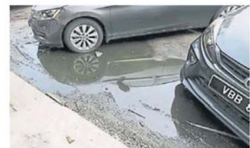
排水系统不佳, 导致停车格常年积水, 驾驶员嫌弄脏不愿把车泊在这里。

“相比之下, 南区市议员在接获路段不属于市议会管辖区的投诉时, 也会协助致电相关部门, 以便要求和监督修补工作, 尤其可见, 服务人员态度很重要, 不是推说不属于自己范围, 就可以卸下一切责任。”