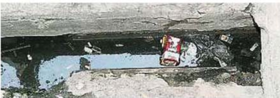
店前小水溝不知何故長年累月堵塞不通，造成蚊子飛舞，恐會有蚊症風險。