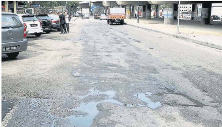
苏丹依布拉欣路破损不堪, 一直备受巴生市民的热议。

他说, 长期如此市民已是无法忍受, 因此也劝请市议员不要再耍太极, 而应尽快改善和修补路段, 以还全巴生市人民安全的道路设施。