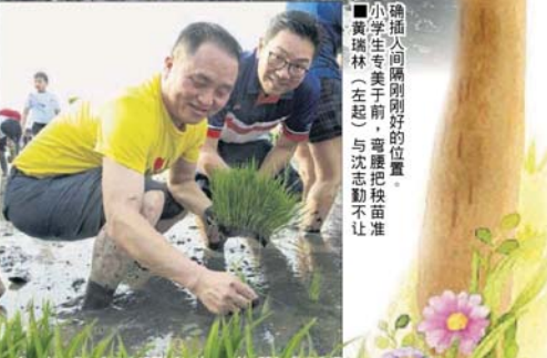
■小学生专美于前，弯腰把秧苗对准插秧人间隔刚好的位置。