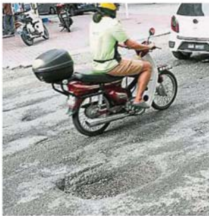
巴生市区100号交通圈柏西兰芬丹依布拉欣的路洞补了又坏、坏了又补，真是周而复始地折腾驾驶人士。

Provided for client's internal research purposes only. May not be further copied, distributed, sold or published in any form without the prior consent of the copyright owner.